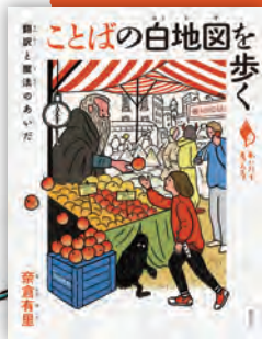
ことばの白地図を歩く ——翻訳と魔法のあいだ 奈倉有里著 / 160頁