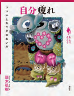
自分疲れ ——ココロとカラダのあいだ 頭木弘樹著 / 160頁