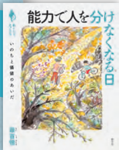
能力で人を分けなくなくなる日 ——いのちと価値のあいだ 最首悟著 / 160頁