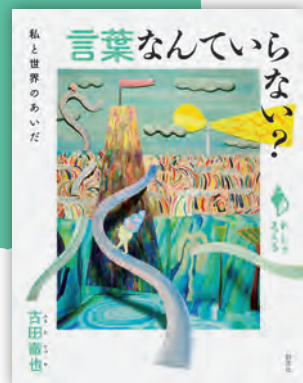
言葉なんていない？ ——私と世界のあいだ 古田徹也著 / 192頁