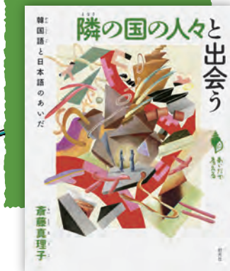
隣の国の人々と出会う ——韓国語と日本語のあいだ 斎藤真理子著 / 160頁