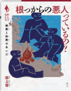
根っからの悪人って いるの？ ——被害と加害のあいだ 坂上香著 / 192頁