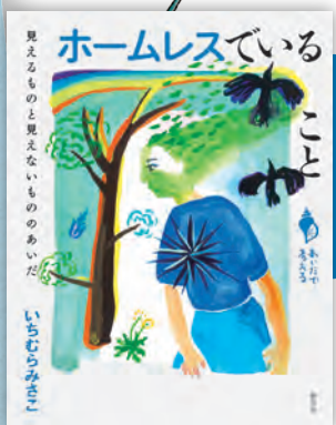
ホームレスでいること ——見えるものと見えないもののあいだ いちむらみさこ著 / 160頁