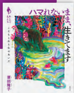
ハマれないまま、生きてます ——ことごととのあいだ 栗田隆子著 / 176頁