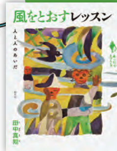
風をとおすレッスン ——人と人のあいだ 田中真知著 / 160頁