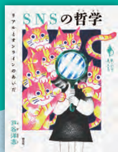
SNSの哲学 ——リアルとオンラインのあいだ 戸谷洋志著 / 144頁