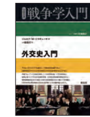
※書影はシリーズ既刊のものです。

現代国際政治への深い洞察で知られ、冷戦史にも通暁する著者による核問題の入門書。核兵器の原理および開発から、冷戦期以降の米ソの戦略、核抑止と核兵器削減交渉を含む軍備管理、ミサイル防衛政策まで、核兵器とそれをめぐる国際政治の論点を初學者向けに解説する。ふたたび国際政治の中核に戻ってきた核兵器について、その背景と基本的な問題を知るうえで最適の一冊。