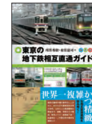
※書影は旧版のものです。

東京メトロ・都営地下鉄と、私鉄各社・JR東日本との相互直通運転の実際を徹底的に解説。直通区間、使用列車はもとより、列車運用の実際、乗務員の担当範囲、運行番号のルール、事業者間の取り決めなど、直通運転の謎を解き明かす。第2版では、相模鉄道の副都心線、南北線、三田線への参入をはじめ、路線図・運用範囲図からコラムに至るまで、あらゆる事項を精査のうえアップデート。世界一複雑かつ精緻な相互直通の全貌に迫る。